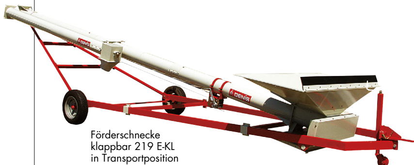
Förderschnecke klappbar 219 E-KL in Transportposition

Hohe Qualität und sorgfältigste Verarbeitung: Alle Einzelteile erhalten nach Entfettung und Phosphatierung eine Einbrennlackierung bei 180°.